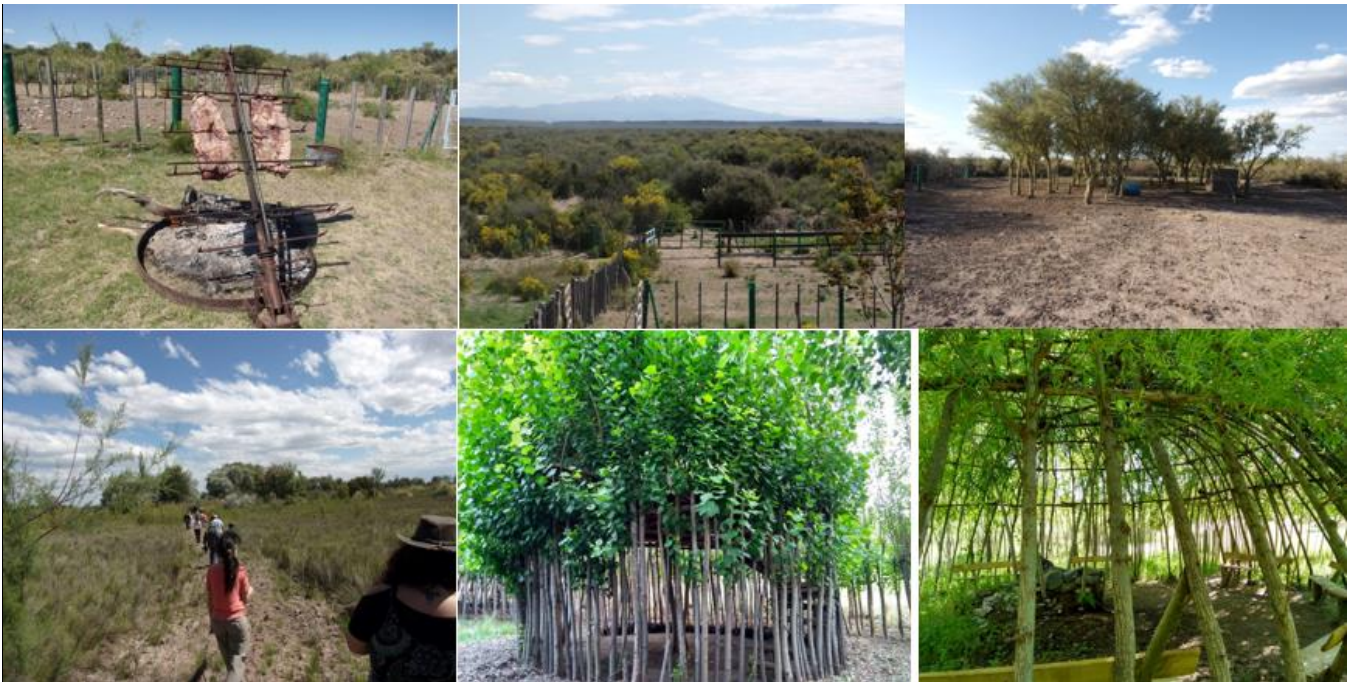
Ver Figura 7: Imágenes de las Vivencias del CLUSTER.