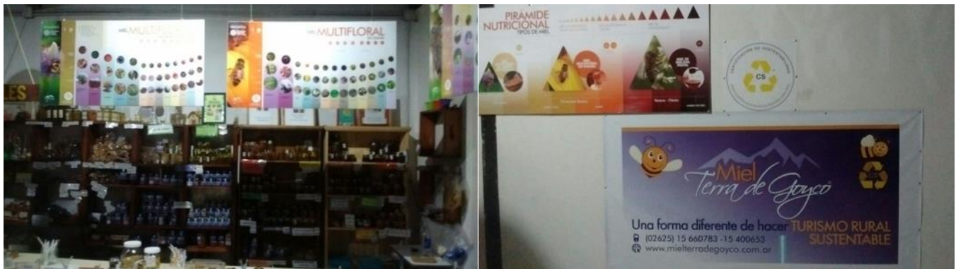
Figura N°2: Sala de Venta con Infografía donde se resalta el sello de Sustentabilidad Nivel 1.