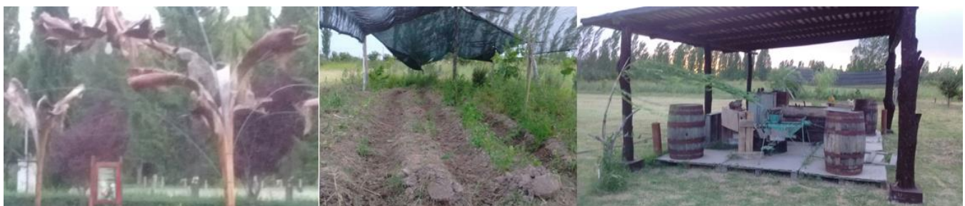
Figura N°5: Iluminación Fotosensible LED, Huerta Orgánica, Museo Histórico Cultural.