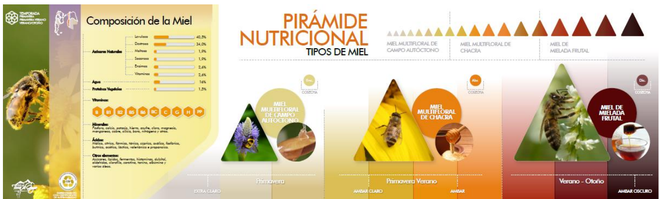
Figura N°8d: Infografías con Logo de Sustentabilidad Nivel 1 incorporados.