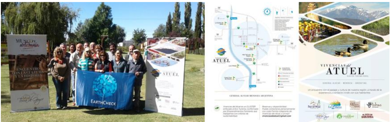
Figura N° 8: CLUSTER VIVENCIAS DEL ATUEL