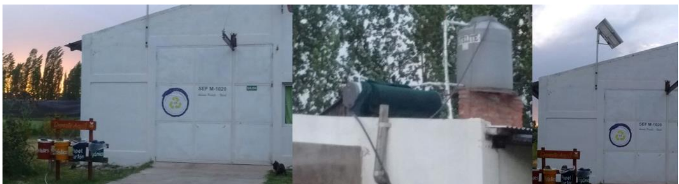
Figura N°4: Punto Verde de Clasificación de Residuos, Termotanque Solar y Pantalla Fotovoltaica.