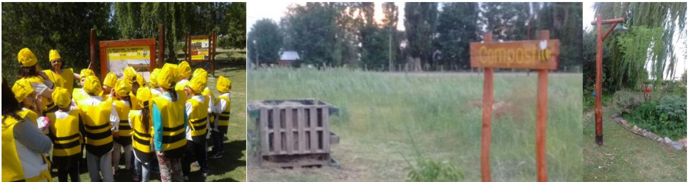
Figura N°6: Visita de Escuelas de Nivel Inicia, Compostera y Área de Aromáticas.