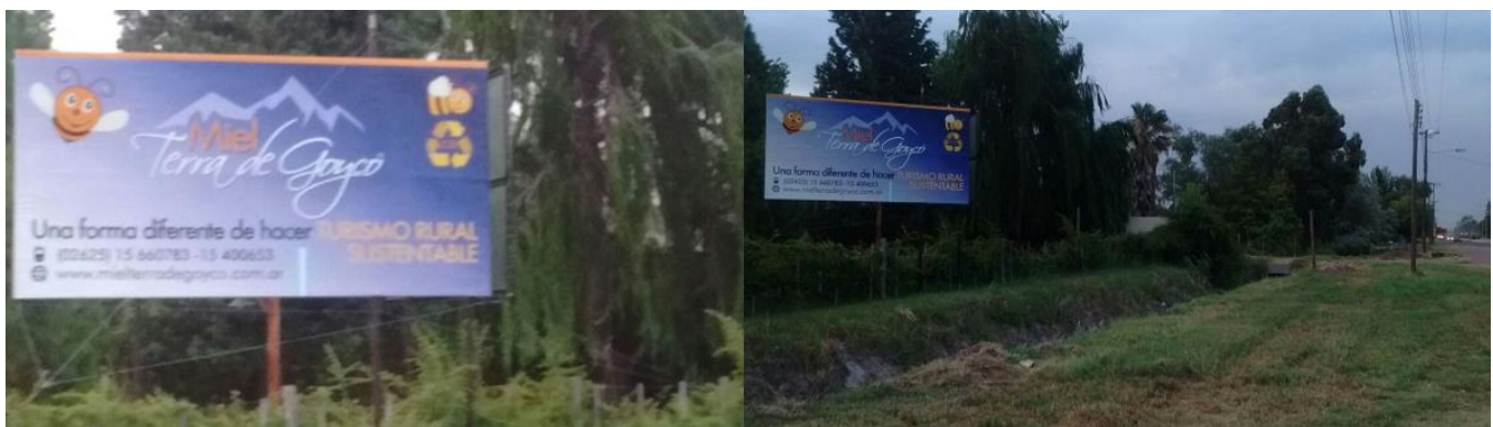
Figura N°3: Megacartería Sustentabilidad al ingreso de la empresa y sobre la Ruta Nacional N° 143.