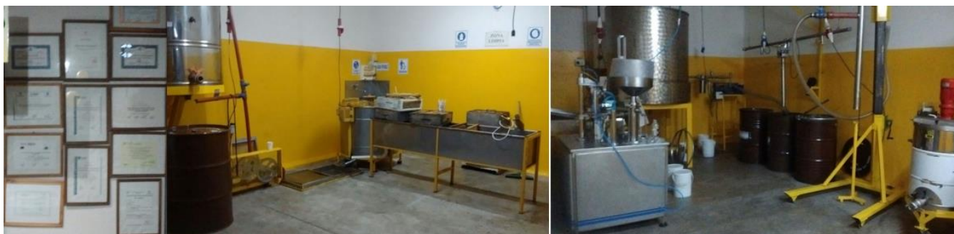
Figura N° 1: Certificador de Calidad y Sala de Proceso.