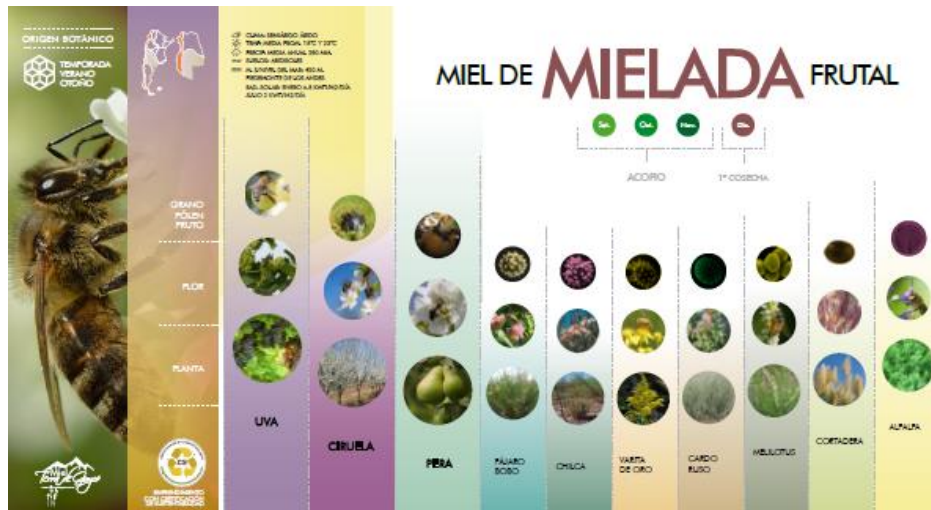
Figura N°8a: Infografías con Logo de Sustentabilidad Nivel 1 incorporados.